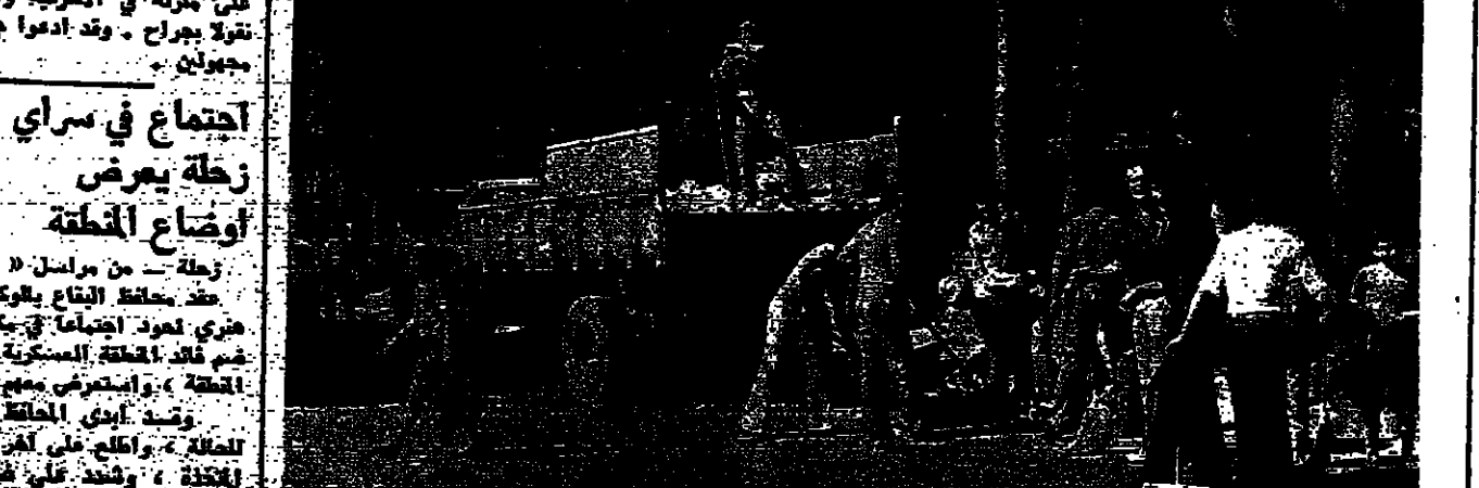
شبان يساهمون بظلمة شوارع المدينة.